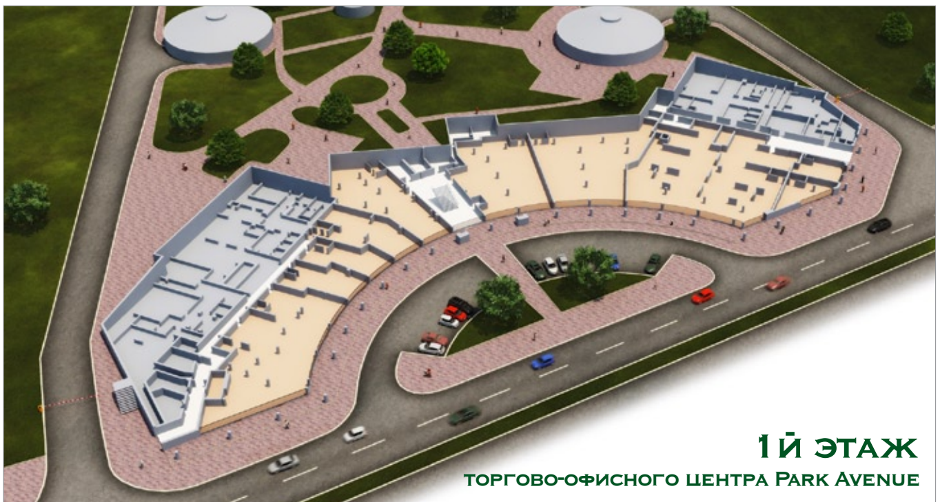
1Й ЭТАЖ ТОРГОВО-ОФИСНОГО ЦЕНТРА PARK AVENUE