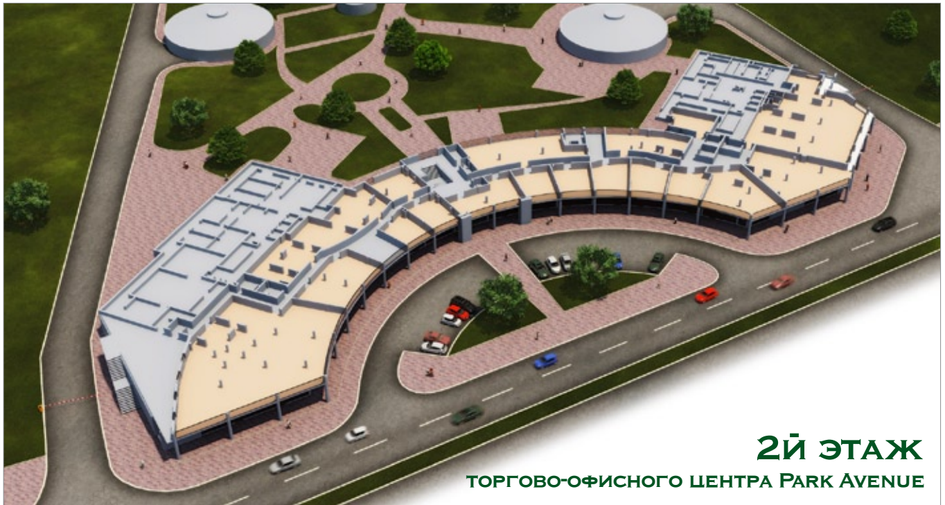
2Й ЭТАЖ ТОРГОВО-ОФИСНОГО ЦЕНТРА PARK AVENUE